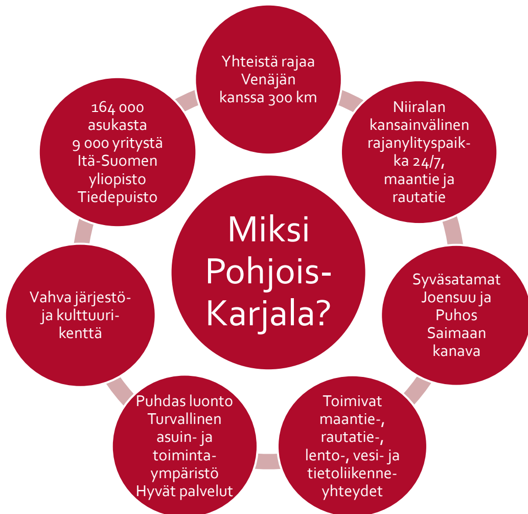
Kuva 2. Pohjois-Karjalan vahvuuksia ja vetovoimatekijöitä.

Pohjois-Karjala on hyvä paikka asua, työskennellä ja yrittää (kuva 2). Puhdas luonto runsaine metsineen ja vesistöineen ja toisaalta kehittynyt asumisen ja liikkumisen infrastruktuuri tarjoavat monipuoliset asumisen ja harrastamisen vaihtoehdot kaupunkiasumisesta luonnonläheiseen maaseutuasumiseen. Toimivat liikenne- ja tietoliikenneyhteydet tarjoavat erinomaiset edellytykset joko fyysisille tai digitaalisille tapaamisille ja monipaikkaiselle työskentelylle. Laadukkaat julkiset sosiaali- ja terveyspalvelut, hyvin järjestetty lasten päivähoito sekä kansainvälistä tunnustusta saanut suomalainen koulujärjestelmä luovat turvallisen asuin- ja elinympäristön kaikenikäisille maakunnan asukkaille. Kattavat julkiset kulttuuripalvelut (teatterit, orkesterit, museot, taideoppilaitokset, kirjastot) sekä aktiivinen paikallinen kulttuuri- ja liikunta-alan järjestötoiminta lisäävät alueen elinvoimaisuutta ja asukkaiden hyvinvointia. Pohjoiskarjalaisuuden ydintä ovat avoimuus, aidot ihmiset, yhteisöllisyys ja pyrkimys, että ketään ei jätetä yksin.