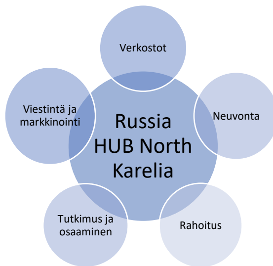
Kuva 3. RussiaHUB North Karelian palvelut

RussiaHUB North Karelian palvelut on ryhmitelty viiteen kokonaisuuteen: verkostot, neuvonta, rahoitus, tieto ja osaaminen, viestintä ja markkinointi sekä (kuva 3).