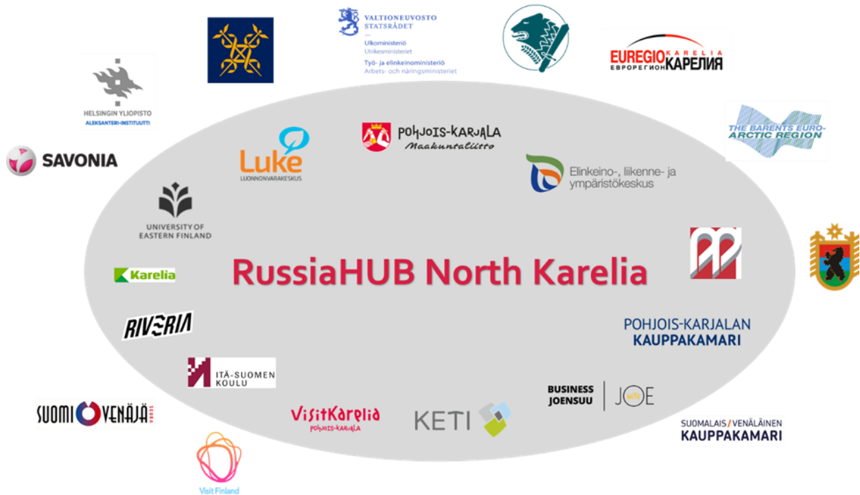
Kuva 4. RussiaHUB North Karelialan toimijat ja verkostoja.

Maakunnan keskeiset Venäjä-toimijat edustavat tutkimusta, koulutuksen kaikkia asteita, yritystoiminnan edunvalvonta- ja kehittämisorganisaatioita, valtio- ja kuntasektoria sekä järjestökenttää. Lisätietoa organisaatiosta ja niiden tarjoamista Venäjä-palveluista yhteystietoineen löydät alla olevista linkeistä.